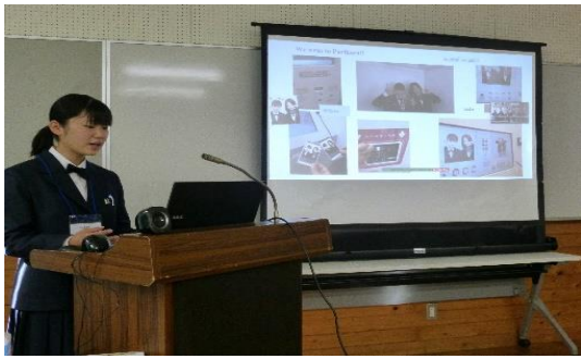
<休日の過ごし方ープリクラについて>