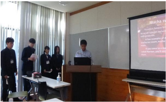
<藤枝の食べ物ー抹茶スイーツについて>

11月3日(木)生涯学習センターにて、市内在住または通学している高校生5名とペンリス市・ペノラカトリックカレッジとキャロラインチザムカレッジの学生と、Zoomでオンライン交流会を開催いたしました。高校生は2つのグループに分かれ、「新しい校舎の紹介、藤枝の食べ物」「お弁当、部活、放課後・休日の過ごし方」について英語で紹介しました。ペノラカトリックカレッジの学生は、「家族、趣味」について、キャロラインチザムカレッジの学生は、「学校、ペンリス市の街」を日本語で紹介して下さいました。