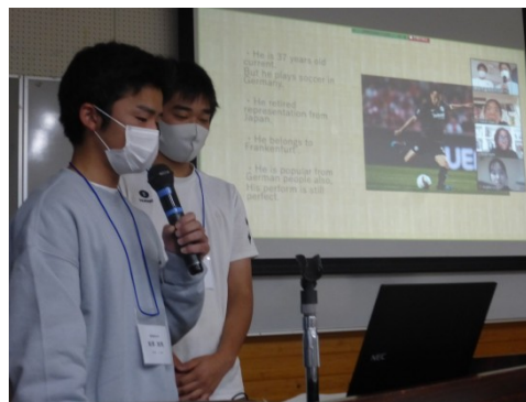
<サッカーについて>