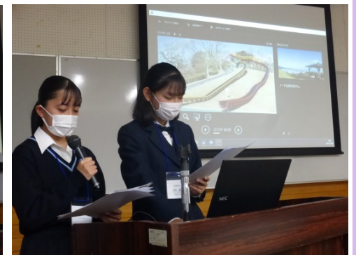
<藤枝市観光スポットについて>