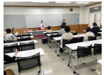
韓服での正式な挨拶の仕方学びました